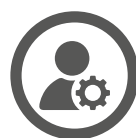
MISE EN CONTEXTE