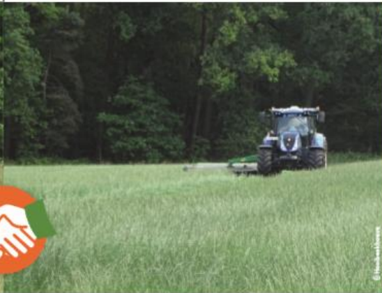
Gedragen maaier van binnen naar buiten