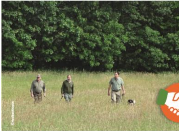
Perceel vreemd maken met honden